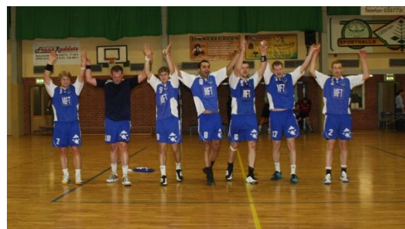
Nach dem Spiel – Mannschaft lässt sich feiern!